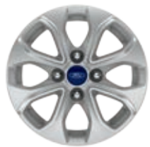
DE ALEACIÓN DE 14" Estándar