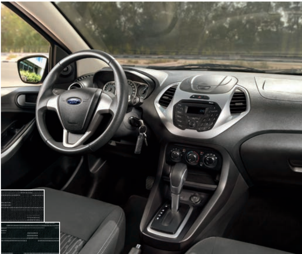
INTERIOR EN TELA COLOR NANJING: Dark Shadow (solo RHD), Charcoal Black