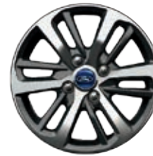
DE ALEACIÓN DE 15" Estándar

Ilustrado con equipo disponible. 1 Use siempre el cinturón de seguridad y asegure a los niños en el asiento trasero.