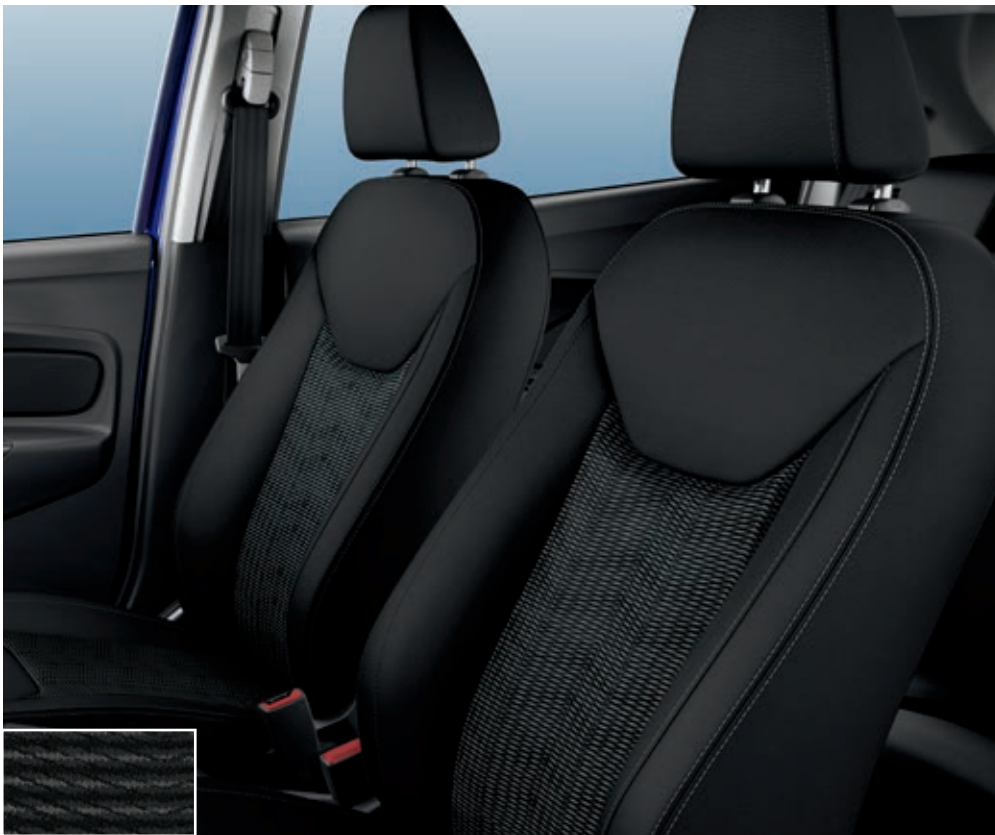
INTERIOR EN TELA COLOR LODHA: Charcoal Black