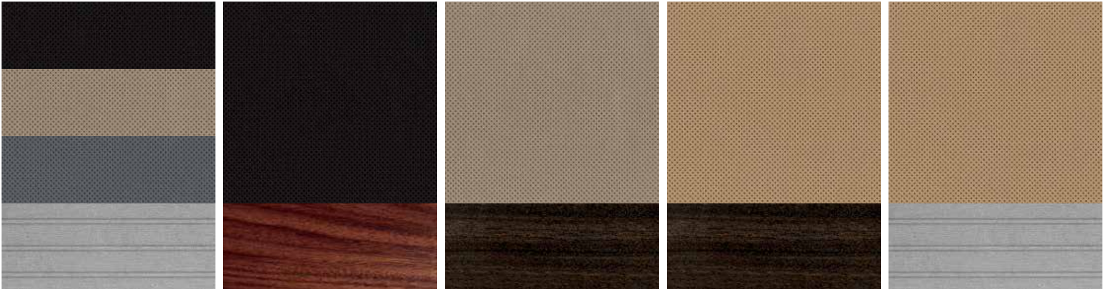
Ebony o Sandstone Corsair² 1-8 Ebony Sandstone Cashew Reserve/Grand Touring 1, 3-10 Medium Slate Corsair² 1-8 Santos Rosewood Paldao Wood Paldao Wood Reserve/Grand Touring 1, 3-10 Pinstripe Aluminum Reserve/Grand Touring 2-9 Reserve/Grand Touring 1-10 Reserve/Grand Touring 1-10 Reserve/Grand Touring 1, 3-10 Cashew Pinstripe Aluminum Reserve/Grand Touring 1, 3-10

Los colores exteriores e interiores mostrados son solo para fines de ilustrativos. 1 Carga adicional. 2 Asientos Lincoln suaves al tacto Soft Touch estándar en Corsair.